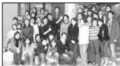
國立台灣師範大學音樂系混聲合唱團

畢業於國立台灣師範附屬高級中學音樂班，現就讀國立台灣師範大學音樂系二年級，主修聲樂，師事薛映東教授。2004年飾演歌劇《斷頭台上的修女》中拉耶穌出來的士兵。